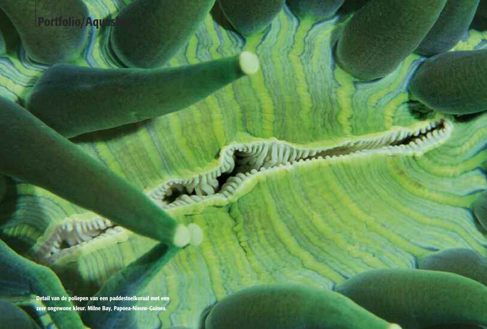
Detail van de poliepen van een paddestoelkoraal met een zeer ongewone kleur. Milne Bay, Papoea-Nieuw-Guinea.