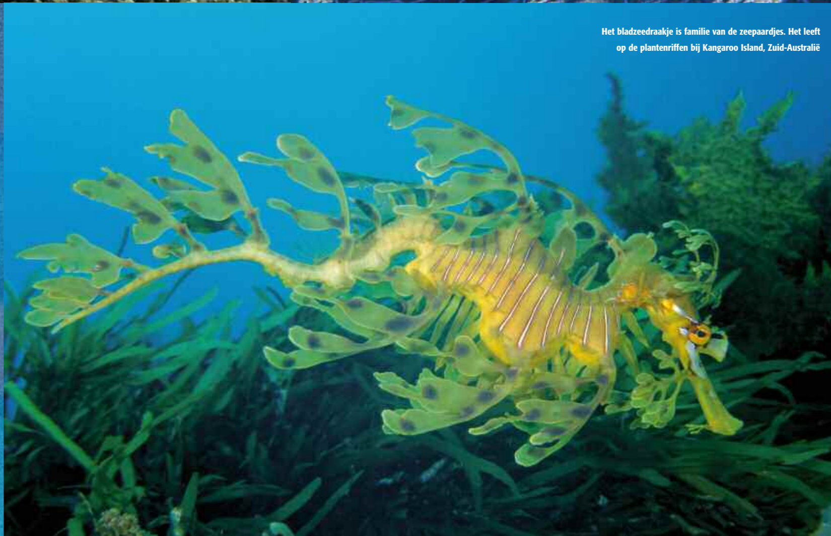
Het bladzeedraakje is familie van de zeepaardjes. Het leeft op de plantenriffen bij Kangaroo Island, Zuid-Australië