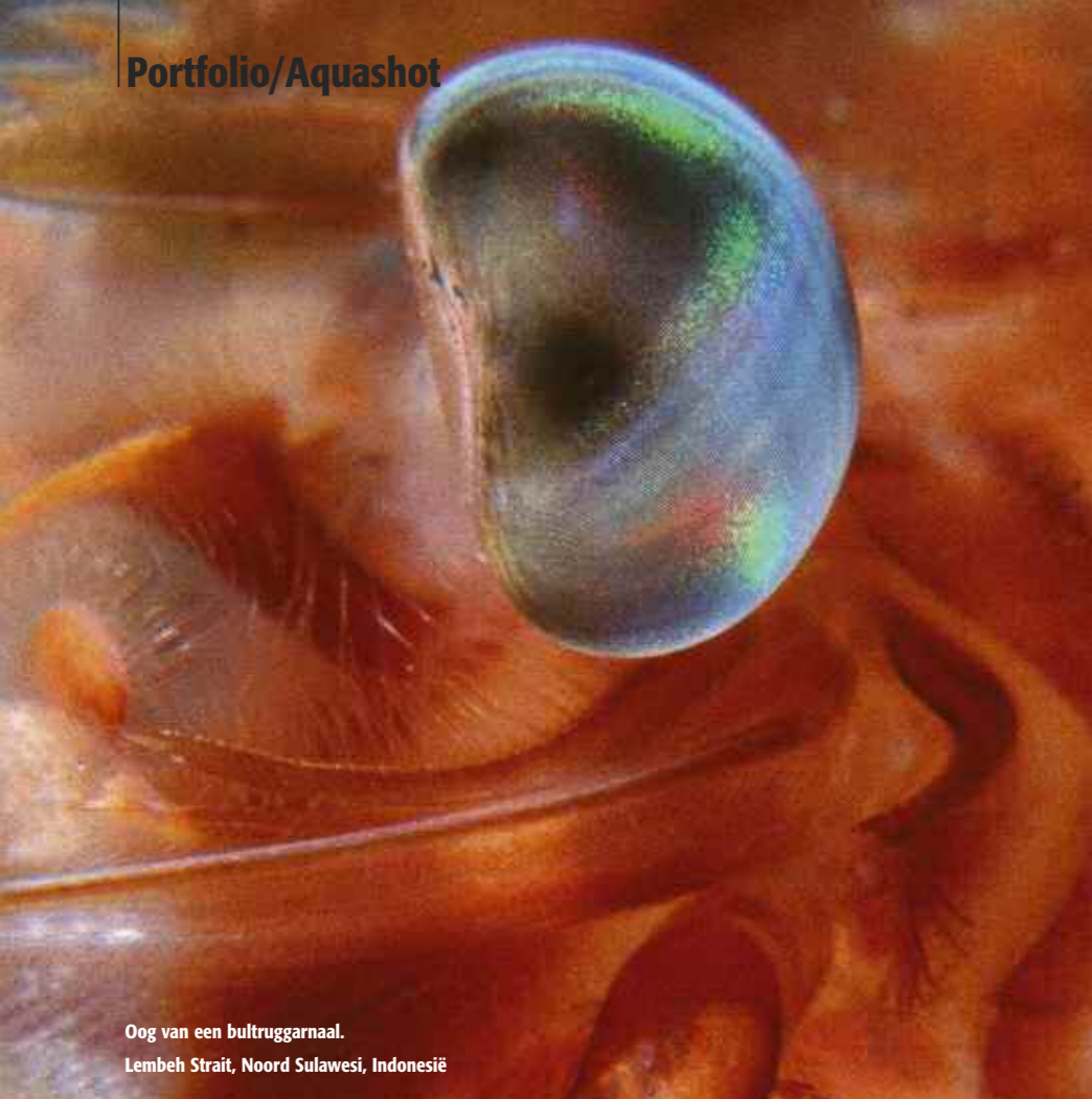
Oog van een bultruggarnaal. Lembeh Strait, Noord Sulawesi, Indonesië