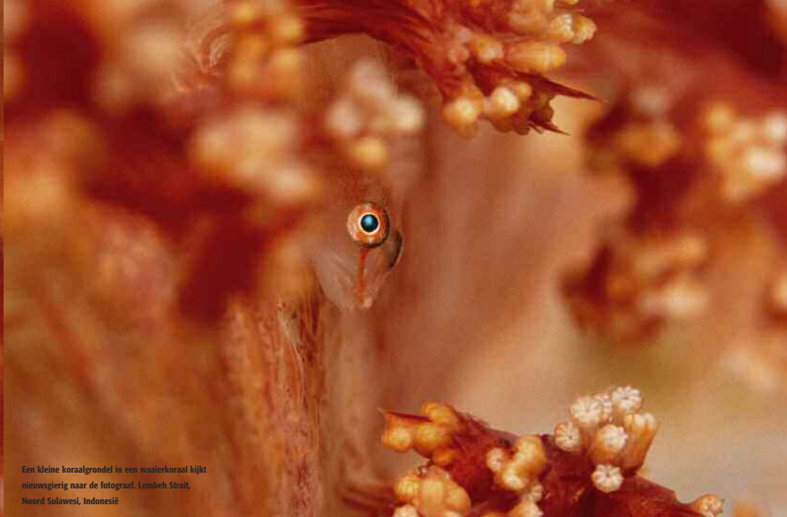
Een kleine koraalgrondel in een waaierkoraal kijkt nieuwsgierig naar de fotograaf. Lembeh Strait, Noord Sulawesi, Indonesië