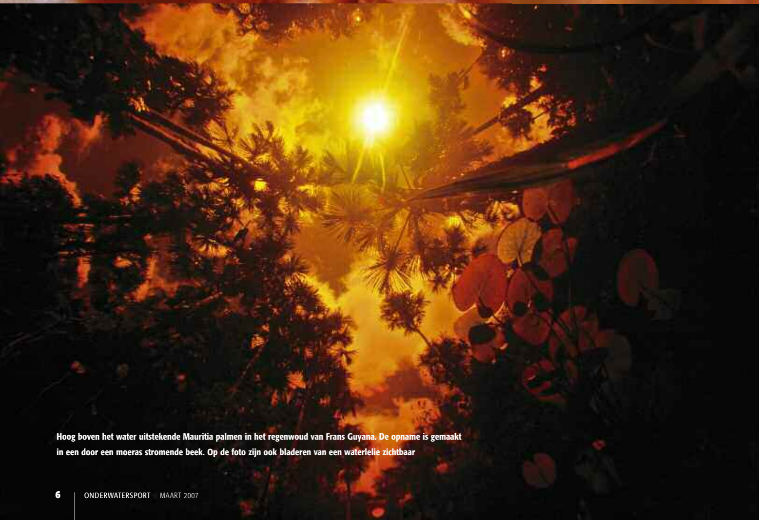
Hoog boven het water uitstekende Mauritia palmen in het regenwoud van Frans Guyana. De opname is gemaakt in een door een moeras stromende beek. Op de foto zijn ook bladeren van een waterlelie zichtbaar