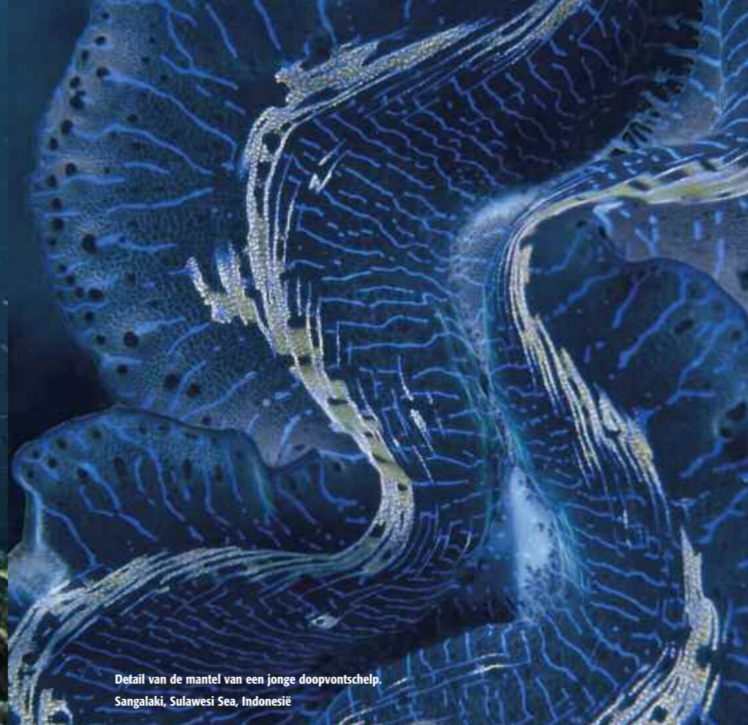
Detail van de mantel van een jonge doopvontschelp. Sangalaki, Sulawesi Sea, Indonesië