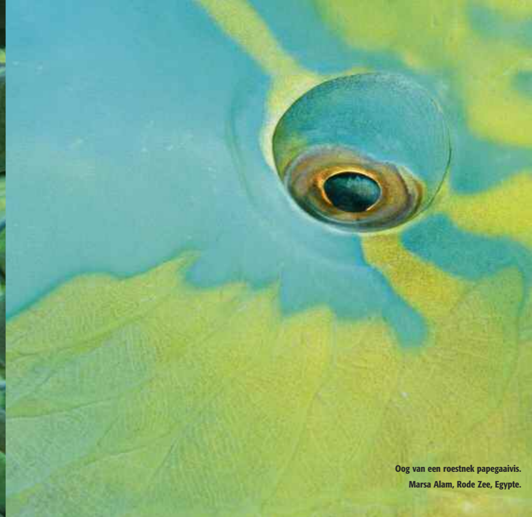
Oog van een roestnek papegaavis. Marsa Alam, Rode Zee, Egypte.