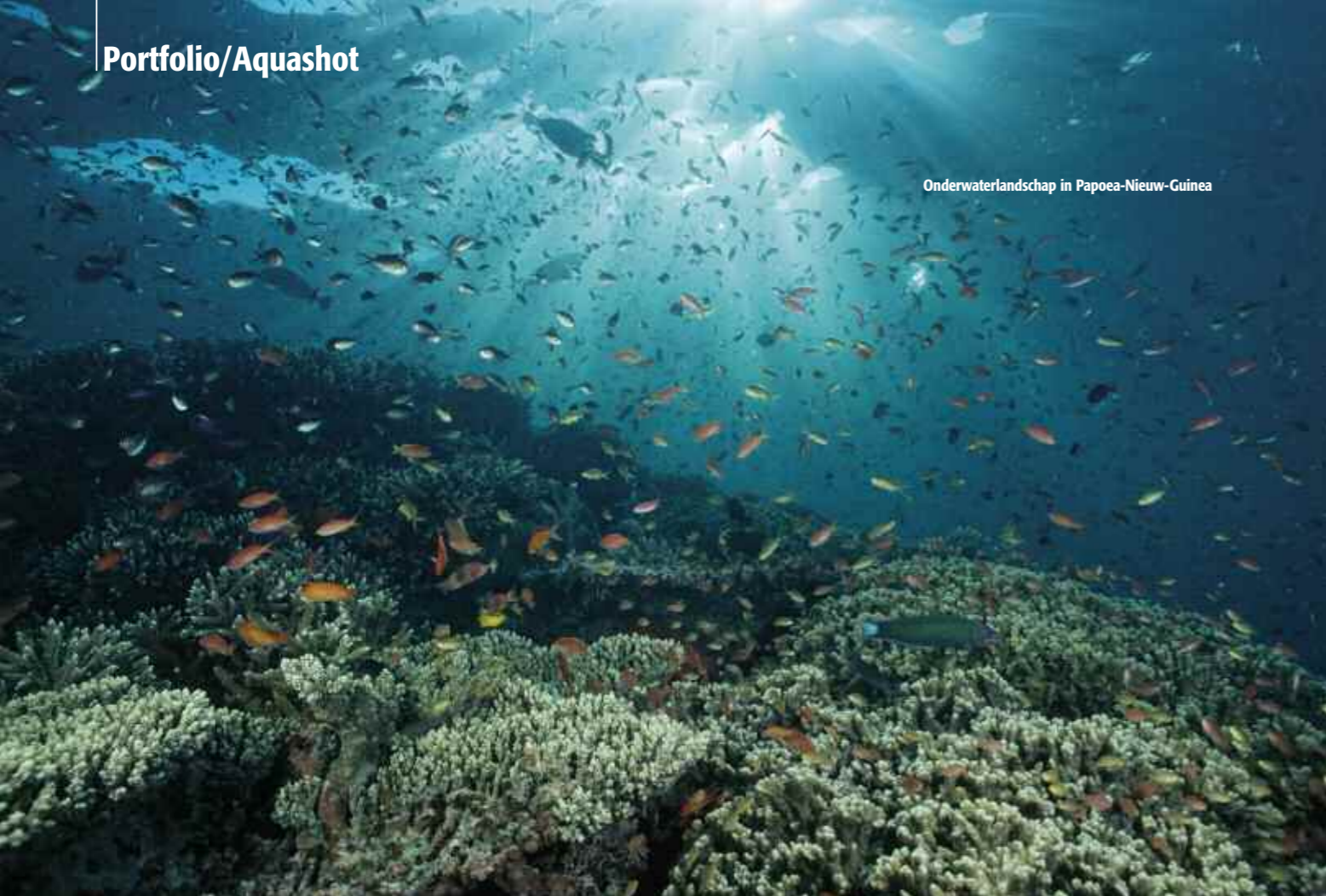
Onderwaterlandschap in Papoea-Nieuw-Guinea