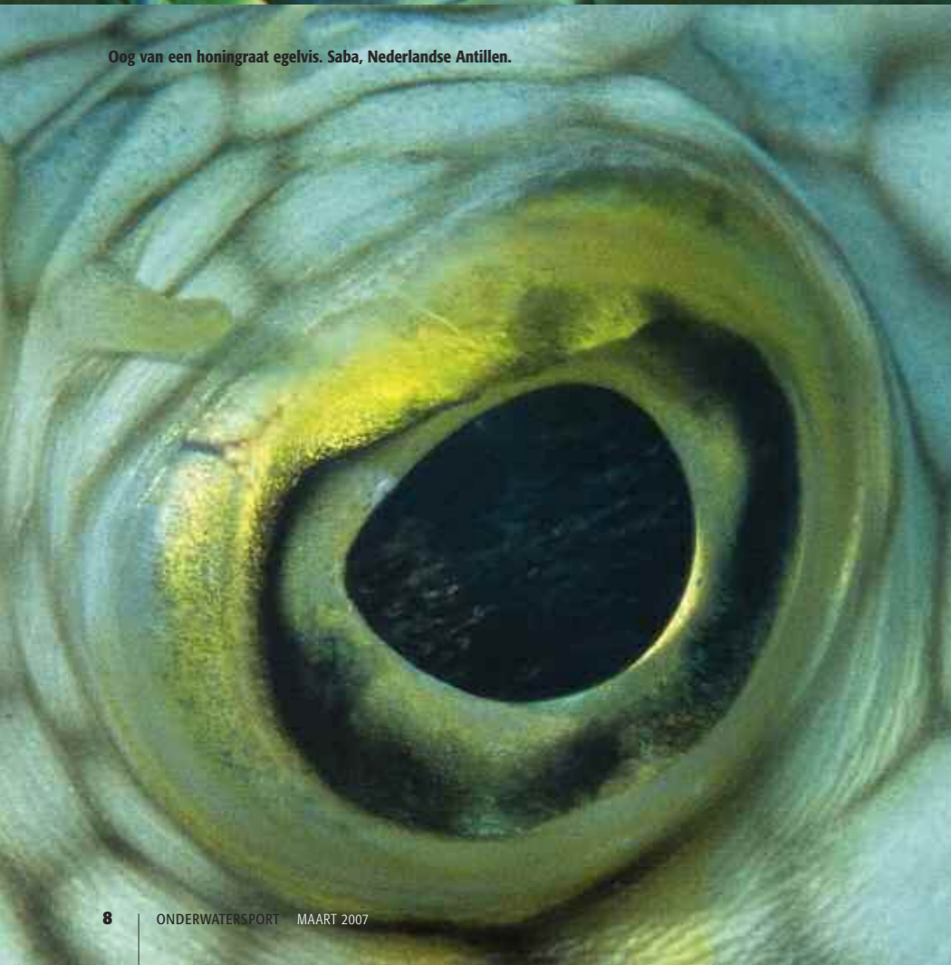
Oog van een honingraat egelvis. Saba, Nederlandse Antillen.