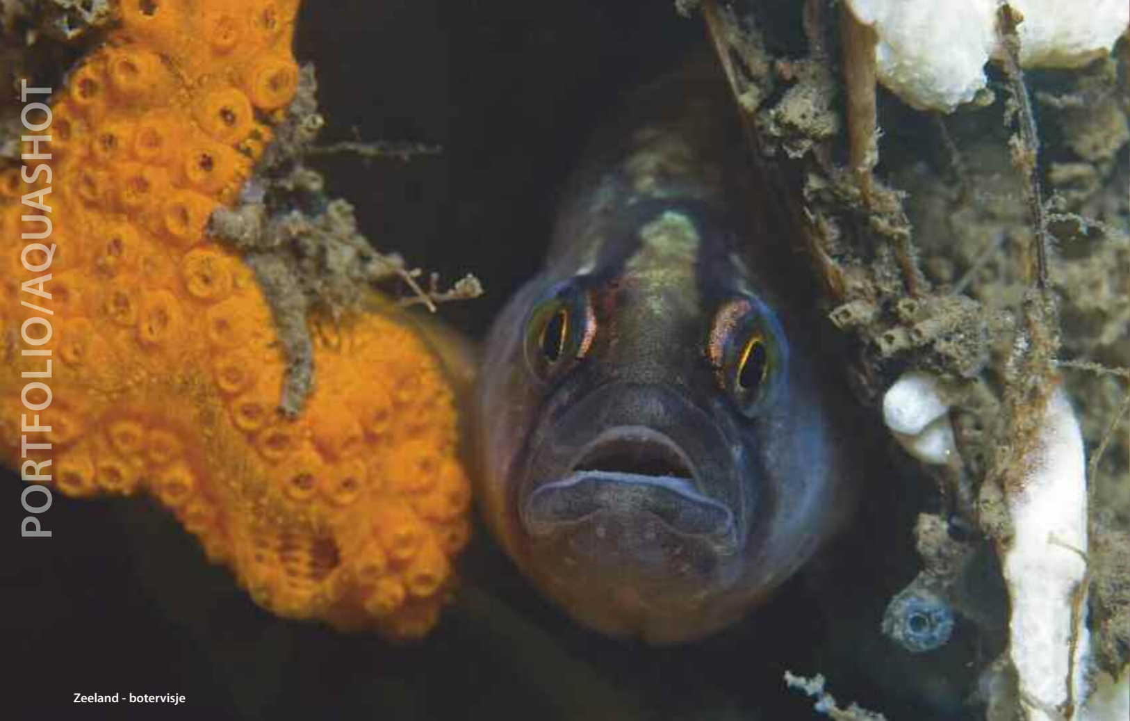
Zeeland - botervisje