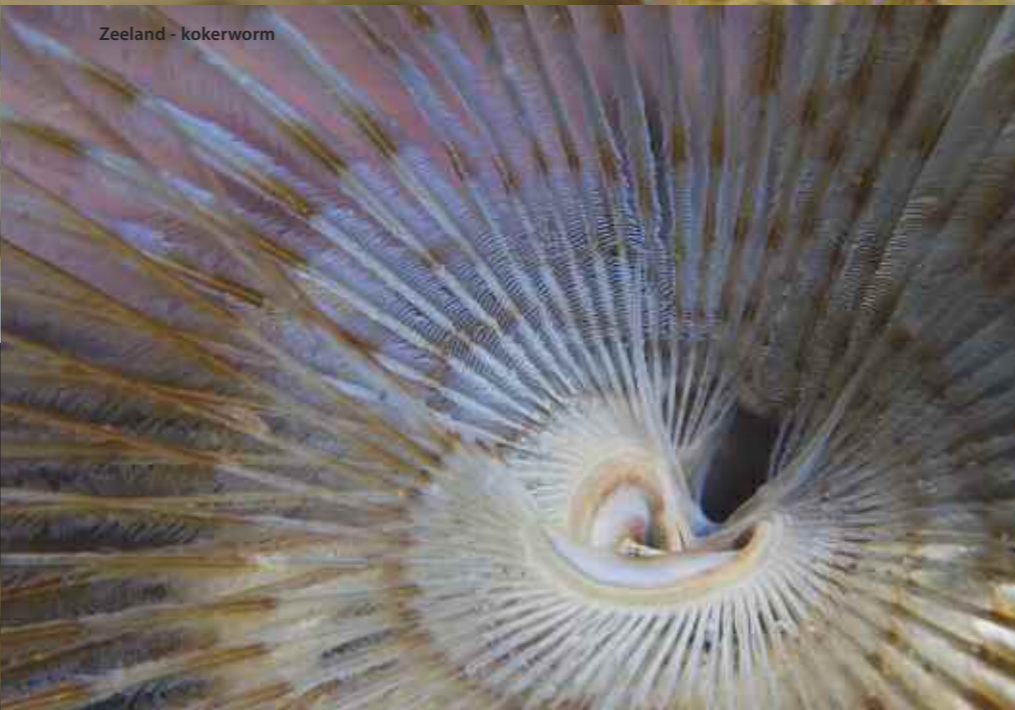
Zeeland - kokerworm