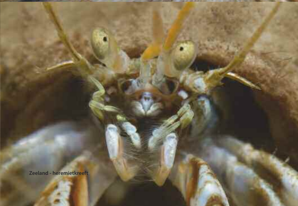
Zeeland - heremietkreeft