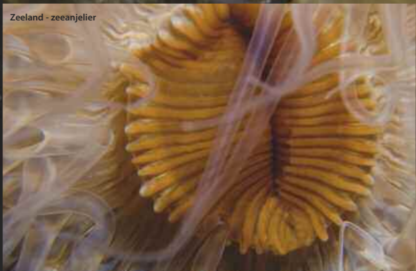
Zeeland - zeeanjelier