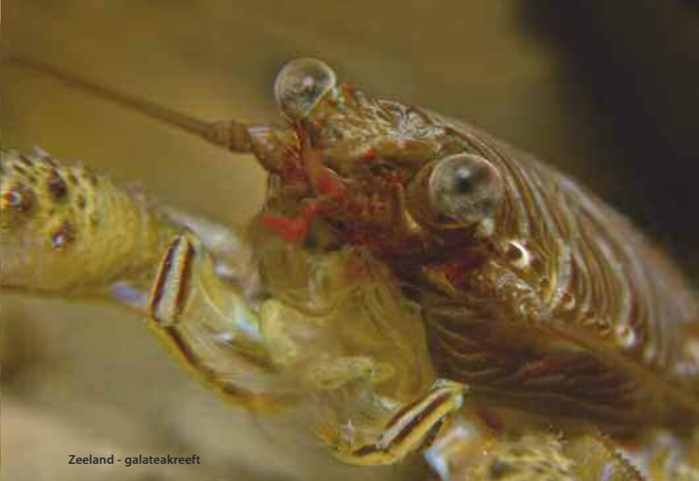
Zeeland - galateakreeft