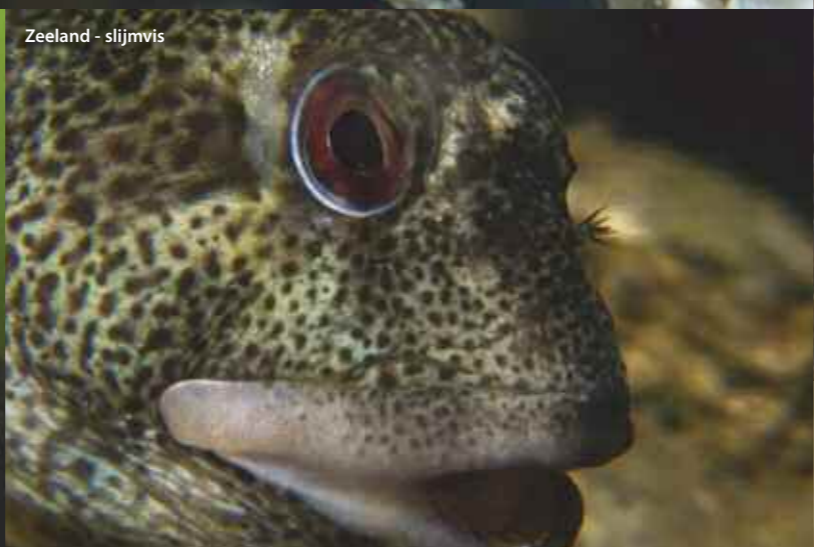
Zeeland - slijmvis