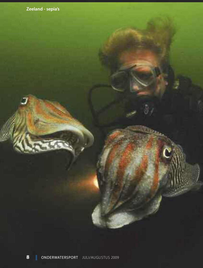
Zeeland - sepia's