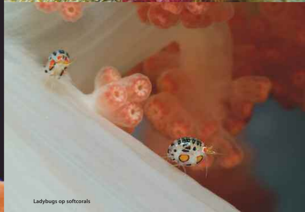
Ladybugs op softcorals