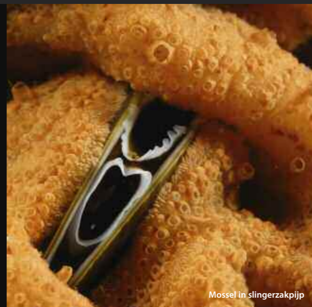
Mossel in slingerzakpijp