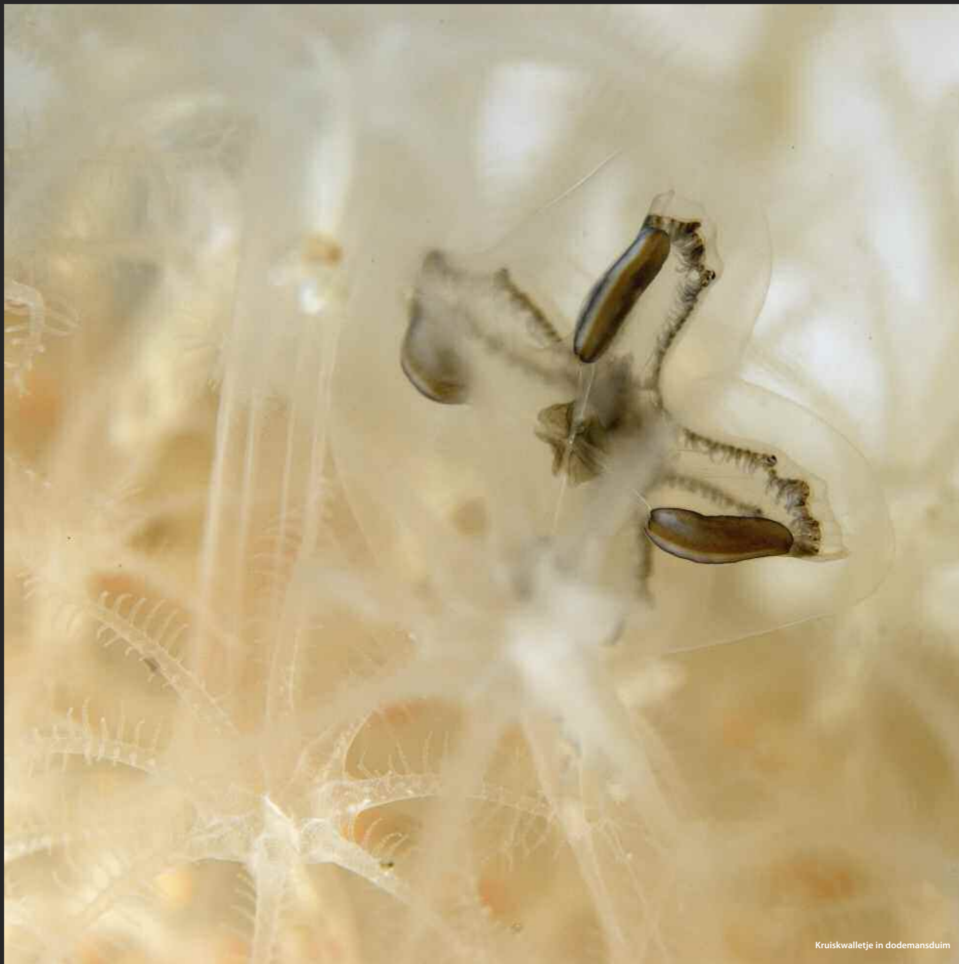
Kruiskwalle in dodemansduim